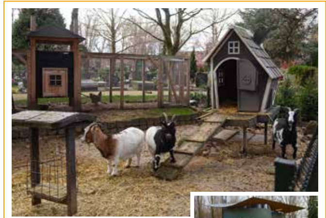
Friedhöfe der Welt (15): Begraafplaats Laurentius, Rotterdam, Niederlande

(Quelle: OLG München, Beschluss vom 30. Januar 2024 – 33 Wx 191/23)