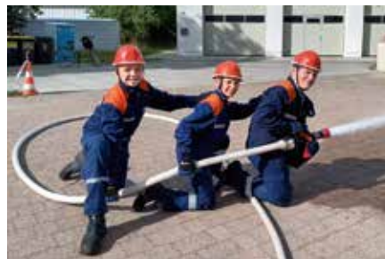
Verein Freiwillige Feuerwehr M'berg-West