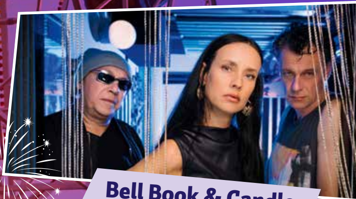
Bell Book & Candle