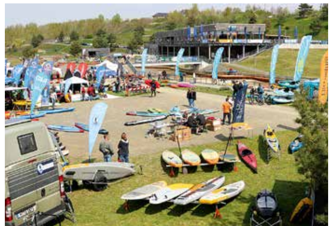
Zum XXL-Paddelfestival werden auf der EXPO eine Vielzahl an Ausstellern ihr neuestes Paddelmaterial und Outdoor-Equipment präsentieren

Prijon (4. Mai, 20.30 Uhr) statt. Außerdem sind geplant: Das SUP Rennen des Anbieters SUPscout und der Kanufreestyle-Workshop von der Deutschen Kanujugend (beides 5. Mai, 11 Uhr), die „PALM Junior Trophy“ (5. Mai, 9.30 Uhr), die Workshops „Was macht Paddeln sicher?“ des Deutschen Kanu-Verbandes (4. Mai, 13 Uhr sowie 5. Mai, 12 Uhr), der Vereinswettbewerb „DKV-Club-Challenge“ (über das ganze Wochenende) sowie der Film- und Foto-Workshop mit Olaf Obsommer (4. Mai, 14.30 Uhr).