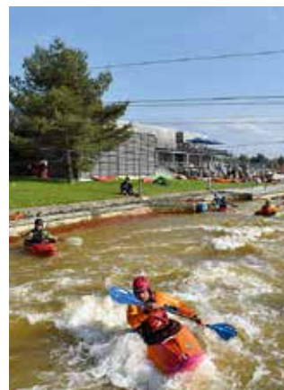
Action auf dem Wasser: Zum XXL-Paddelfestival kann insgesamt 21 Stunden lang auf den Kanälen des Kanuparks gepaddelt werden

Informationen zum Programm und zu den Möglichkeiten der Anmeldung gibt es unter www.paddelfestival.de .