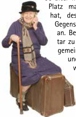
Wir lassen Sie nicht auf Ihren Koffern sitzen!

Je älter man wird und je mehr Platz man im eigenen Haus hat, desto mehr persönliche Gegenstände sammelt man an. Beginnen Sie, Ihr Inventar zu reduzieren, indem Sie gemeinsam mit Ihren Kindern und Freunden überlegen, welche Gegenstände Sie behalten möchten und welche Sie