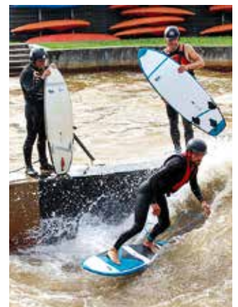
Spaß auf der Welle 2.0: Erstmals findet im Rahmen des XXL-Paddelfestivals auch ein dreitägiges Surf-Special statt