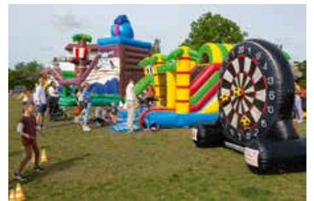
Markkleeberger Bilderbogen Borsteltag am Cospudener See